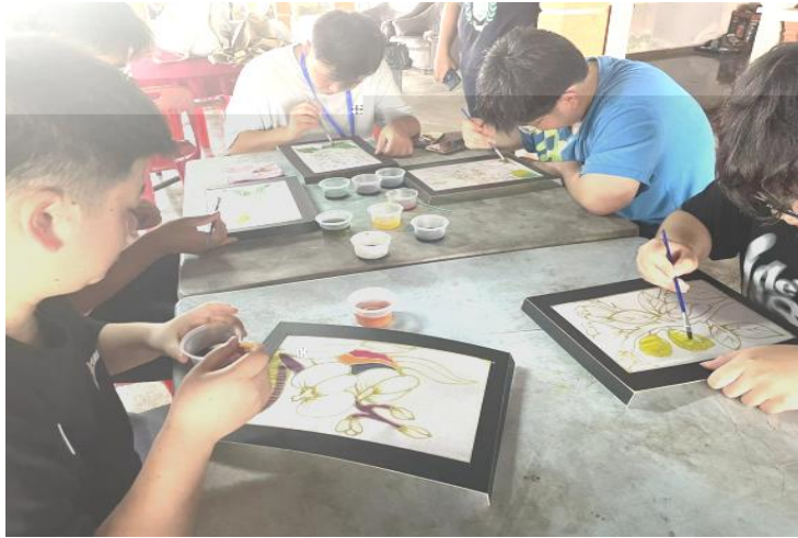
Experience Wax Painting&Drawing