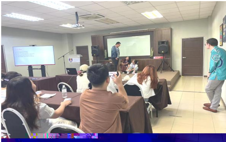
English Enrichment Course Class