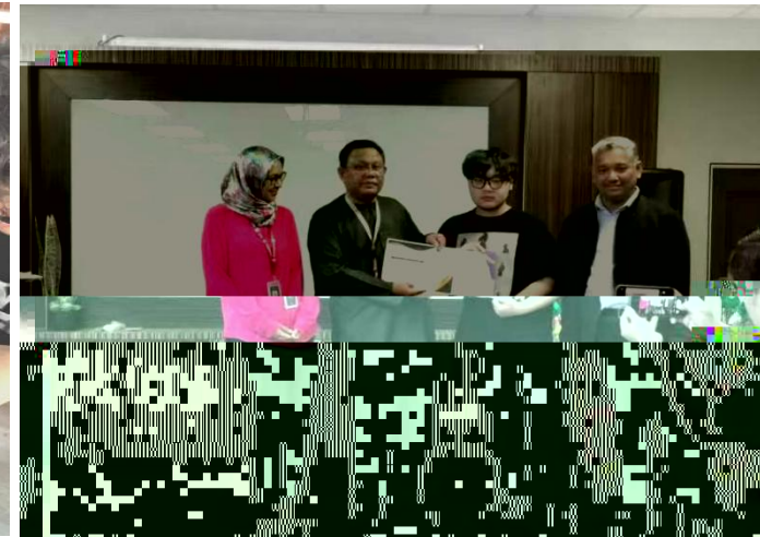
Certificate of Completion Grant