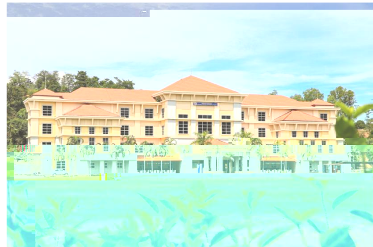
Tunku Abdul Rahman Library