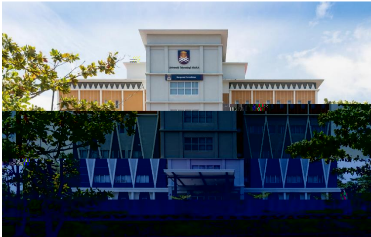
Administration Building / Rectorate